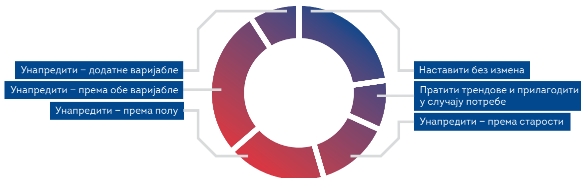
Графикон 1: Преглед препорука за унапређење Миграционог профила према садржају

Најрањивије групе, као што су малолетници без пратње, деца мигранти, повратници школског узраста и жене у миграцији, често остају недовољно видљиве у стандардној статистици. Управо због тога, прикупљање, систематизовање и анализа података који су родно и старосно разграђени представљају не само добру праксу већ и неопходност за формулисање ефикасних и правично оријентисаних политика.