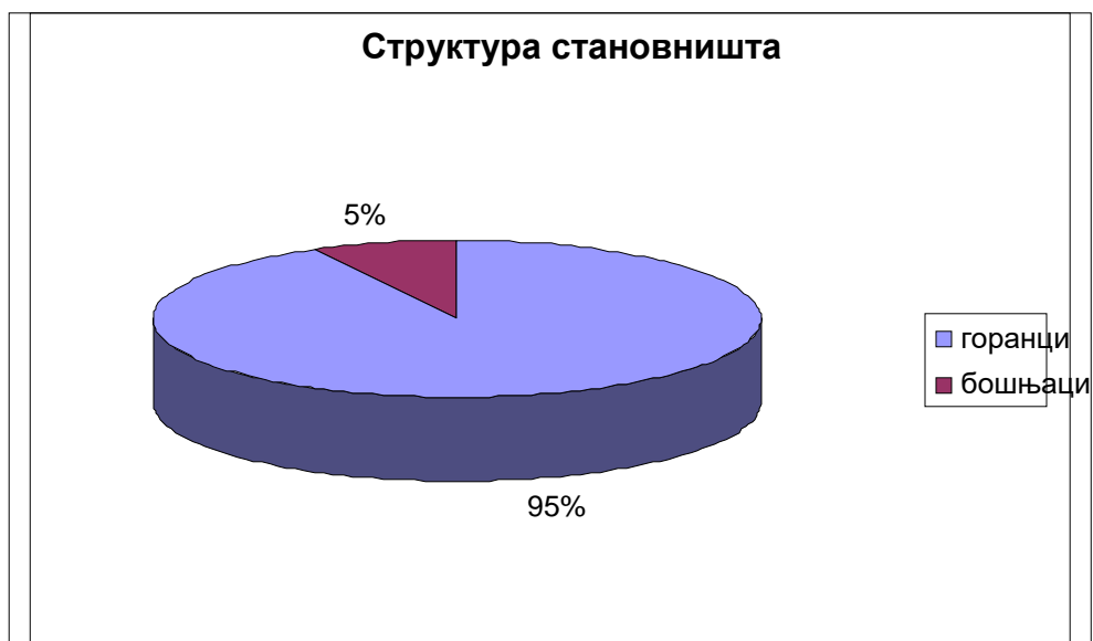
Графикон 1. Етничка структура становништва