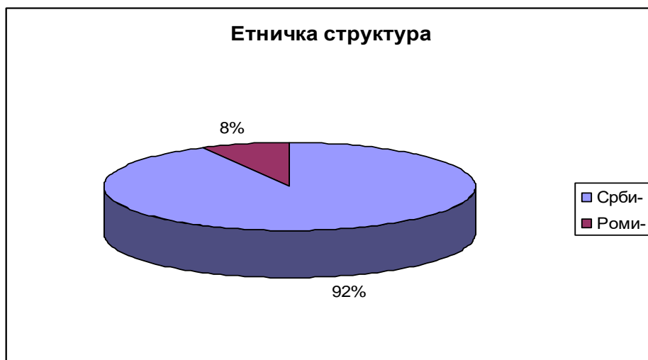
Графикон 1. Етничка структура становништва