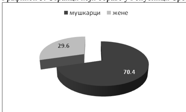
Графикон 3: Странци који бораве у Републици Србији на основу рада, 2010. година

Међу странцима који су у Републици Србији боравили на основу рада, изразиту већину чине мушкарци.