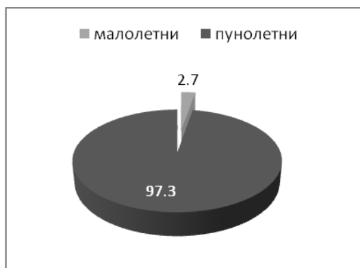
Графикон 2: Странци стално настањени у Републици Србији 2010. године, према старости