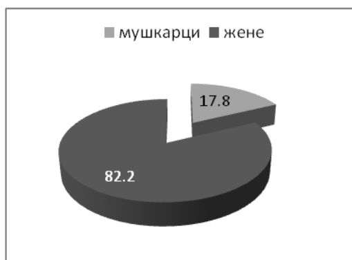
Графикон 1: Страни држављани и држављанке стално настањени у Републици Србији 2010. године

Међу стално настањеним странцима доминирају жене, што указује да ове стално настањене странкиње претежно склапају бракове са држављанима Републике Србије. Малолетна лица су заступљена међу стално настањеним странцима у врло малом броју.