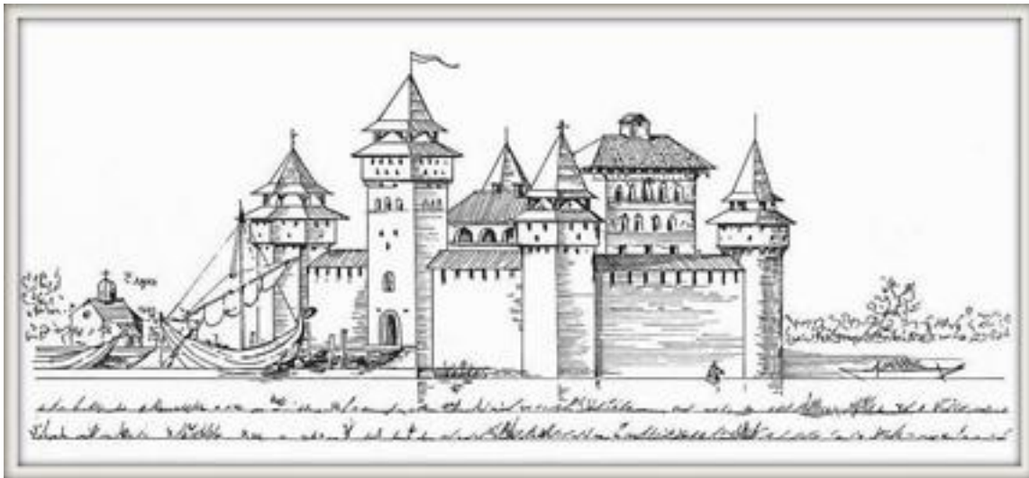
Слика 6. Предпостављени изглед Купиника

За туризам општине Пећинци, али и региона Срема, па и читаве државе би пројекат ревитализације Купиника био од изузетног значаја. У плану је да се ради на овом локалитету све што у овим условима закон и струка дозвољавају.