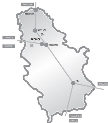
Слика 3. Географски и саобраћајни положај општине Пећинци на карти Р. Србије

Простор на коме се простира општина Пећинци обилује изузетним природним и културно-историјским лепотама и вредностима погодним за развој туризма. Обедска бара, река Сава, велика пространства аутохтоних храстових и других шума, богата и разноврсна флора и фауна, али и споменици културе из средњег века, раритети народног градитељства, музеј - јединствен на овим просторима, само су део богатства које завређује туристичку валоризацију.