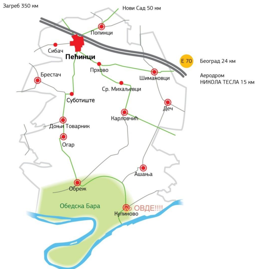
Слика 4. Мапа општине Пећинци

Рутом је повезан крајњи север и југ општине Пећинци, тј. села - Пећинци и Купиново, а у сваком насељу кроз које се пролази мапирано је нешто интересно и препоручено туристима.