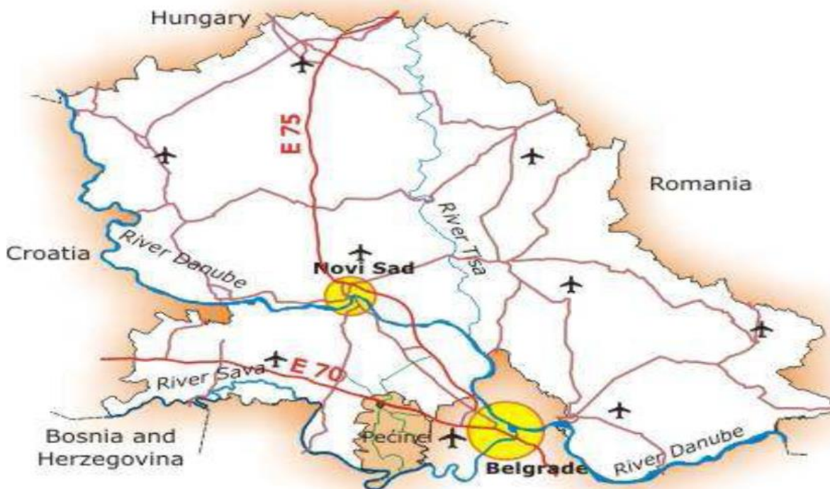
Слика 1. Мапа АП Војводине

Општина Пећинци лоцирана је у Доњем, равном Срему, који се у овом делу назива још и Подлужје. На истоку општина Пећинци се граничи са београдским подручјем, на североистоку са општином Стара Пазова, на северу и западу са општином Рума, а на југу границу чини река Сава. Општинско подручје има неправилан облик.