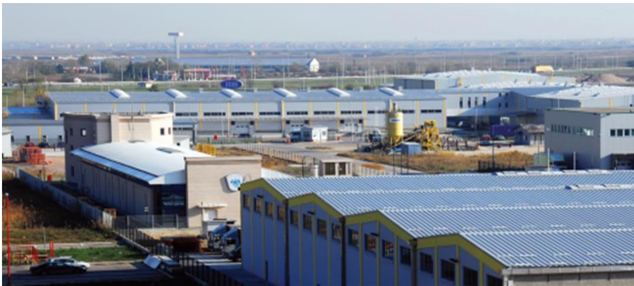
Слика 2. Радна зона Шимановци

тржиштем квалитетне радне снаге. Налазимо се на удаљености од 25 км од Београда и 15 км од међународног аеродрома „Никола Тесла“. Кроз северни део Општине пролази ауто-пут Е-70 који је крак европског коридора 10. У зони ауто-пута Е 70 у Радној зони Шимановци до сада је реализован највећи број инвестиција, уз стално интересовање нових инвеститора за реализацију нових пројеката.