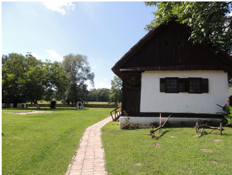
Слика 7. Етно кућа Купиново

Типичан пример народног градитељства с краја XVIII века, је кућа породице Путник. Ова етно-кућа са помоћним објектима и окућницом, околних девет кућа као и црква св. Луке, чине етно комплекс Купинова. У дворишту Етно куће је и седиште ТО Пећинци, као и летњиковач, сувенирница, археолошка играоница. Овде је почетна тачка развоја туризма и место које привлачи све већи број посетилаца.