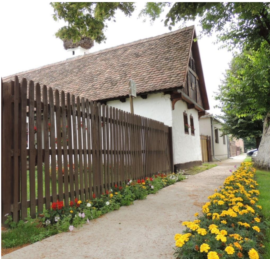
Слика 5. Аксентијев кућерак у Огару

последње три године уложио много труда и средстава добијених преко пројеката, што нам говори о значају ове куће за етнолигију и културу Срема. У дворишту Етно куће је направљен летњиковац и ђерам, а деци су на располагању и лопте и голови за игру, а у плану је и постављање дрвоног дечјег игралишта.