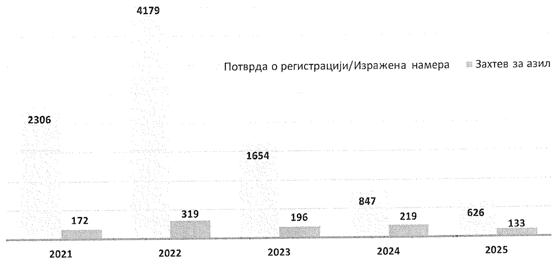
Графикон 2: Потврде о регистрацији странаца који је изразио намеру да поднесе захтев за азил и захтеви за азил у периоду од 2021. до 2025. године

Број смештених лица у центрима Комесаријата за избеглице и миграције Републике Србије (у даљем тексту: Комесаријат), у току 2025. године, је био 9.757 миграната и тражилаца азила, што представља смањење од 49,92% у поређењу са 2024. годином, када је у центрима евидентирано 19.483 лица. Просечно задржавање смештених лица се и даље скраћује, тако да је просечно задржавање у 2025. години било 6 дана у односу на 9 дана током 2024. године. Значајан пад је евидентиран и у просечном броју смештених лица на дневном нивоу који је са 713 у 2024. години пао на 349 у 2025. години. Непромењена је остала структура миграната који су евидентирани у центрима у односу на пол, старост и породичну структуру, па највећи део и даље чине самци мушког пола. Број малолетних лица без пратње се процентуално повећао у 2025, тако да је 16% од укупног броја евидентираних било из ове популације, што је значајно више од 5% из 2024.