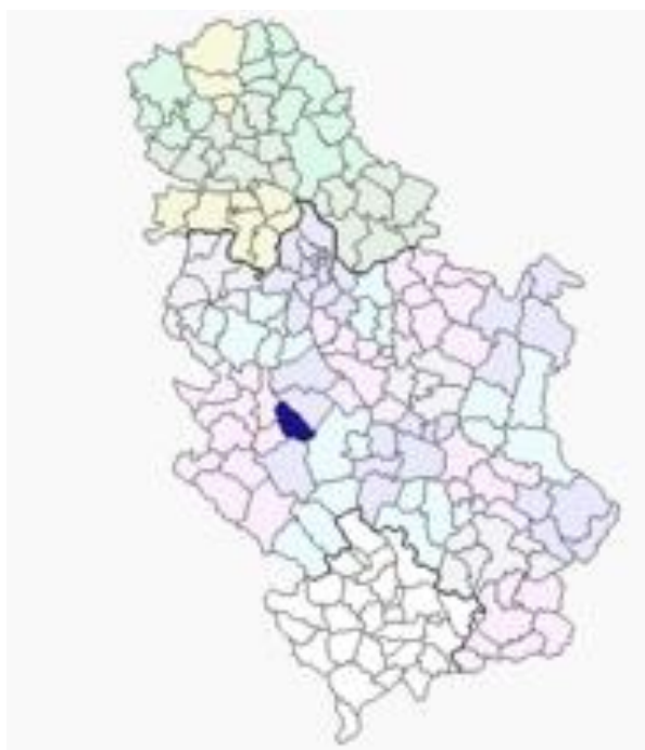
Слика 1. Положај општине Лучани на територији Републике Србије