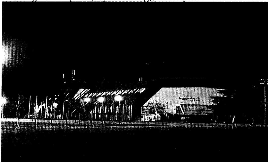
Спортско рекреативни центар «Колубара» Лазаревац

Објекти за спорт и рекреацију – На територији ГО Лазаревац постоји велики број спортско-рекреативних центара и спортских терена. Највећи је Спортски центар “Колубара” у Лазаревцу који се састоји од фудбалског стадиона са помоћним тереном, бетонских игралишта за кошарку, одбојку и рукомет, старе сале “Партизан”, нове велике и помоћне сале, затвореног базена и осталих пратећих објеката. У Лазаревцу се налази и Спортско-рекреативни центар “Очага” са језером, шумом и теренима за рекреацију. Велики спортски центар “ТЕК” у Великим Црљенима, осим фудбалског терена, обухвата затворени базен, бетонско игралиште за кошарку, теретану и помоћне објекте. Остала места имају мање спортске центре или само фудбалске терене.