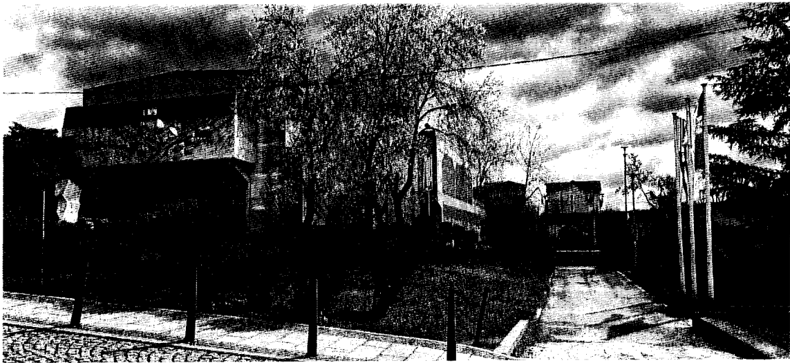
Центар за културу Лазаревац

Такође, објекат од значаја на територији ГО Лазаревац је и Центар за културу Лазаревац. Изграђен је 1977. године и у холу Центра налази се спомен рељеф са ликом.