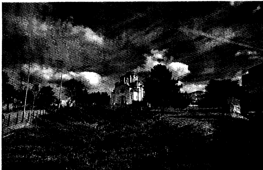
Црква и споменкостурница Свети Димитрије у Лазаревцу

Културно-историјско наслеђе ГО Лазаревац не обилује споменицима или заштићеним амбијенталним целинама. Заштићени споменици културе примарног значаја предвиђени за трајно чување су: Црква светог Димитрија, Спомен костурница изгинулих ратника у Колубарској бици 1914. године, гробље (варошки део) из XIX века, Цркве брвнаре у Вреоцима и Брајковцу. Историјски објекти посебних вредности су: спомен парк Димитрију Туцовићу – локалитет Враче брдо; зграда библиотеке у Улици Карађорђевој број 57.