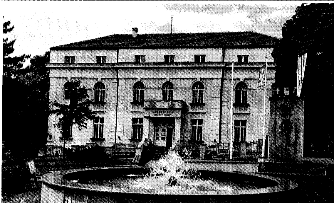
Библиотека „Димитрије Туцовић“ у Лазаревцу.

Објекти за спорт и рекреацију – На територији ГО Лазаревац постоји велики број спортско-рекреативних центара и спортских терена. Највећи је Спортски центар “Колубара” у Лазаревцу који се састоји од фудбалског стадиона са помоћним тереном, бетонских игралишта за кошарку, одбојку и рукомет, старе сале “Партизан”, нове велике и помоћне сале, затвореног базена и осталих пратећих објеката. У Лазаревцу се налази и Спортско-рекреативни центар “Очага” са језером, шумом и теренима за рекреацију. Велики спортски центар “ТЕК” у Великим Црљенима, осим фудбалског терена, обухвата затворени базен, бетонско игралиште за кошарку, теретану и помоћне објекте. Остала места имају мање спортске центре или само фудбалске терене.