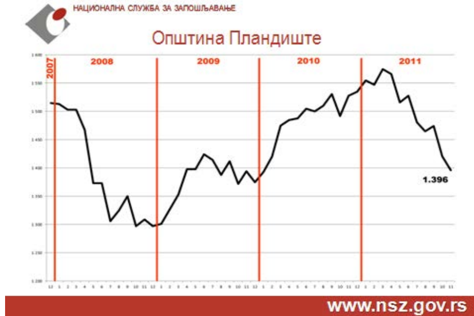
Графикон број 1.