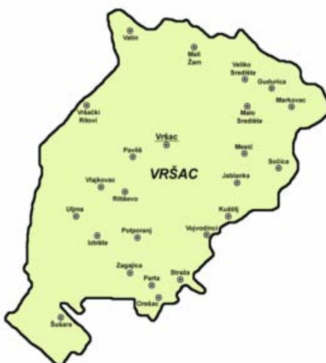
Слика 2: општина Вршац

Укупна површина града износи 10 км 2 са 180 улица, 11 тргова и 3 булеварара. Надморска висина у центру града је 94 метара.