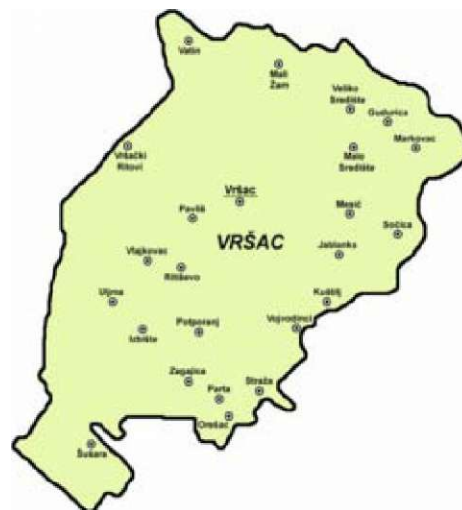
Слика 2: општина Вршац